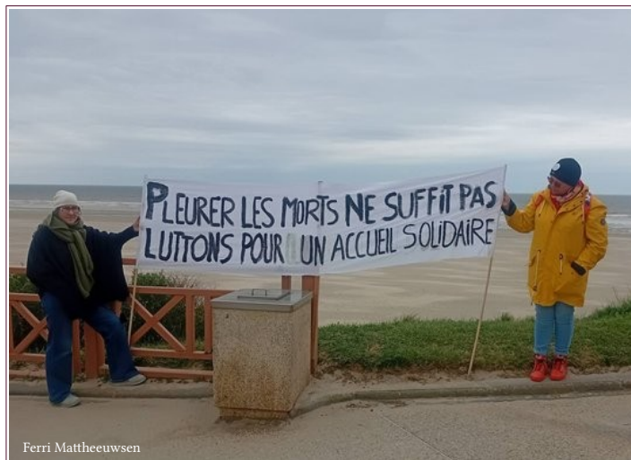
Commémoration après décès, le 11 avril 2026 à Equihen.

Soutenons , Aidons , Luttons , Agissons Pour les Migrants ! Et les pays En difficulté