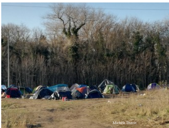
Calais, rue des Verrotières

Le nombre de migrants a bien diminué à Grande-Synthe (environ 250 tout le mois de décembre), mais augmenté de façon importante à Calais (plusieurs centaines).