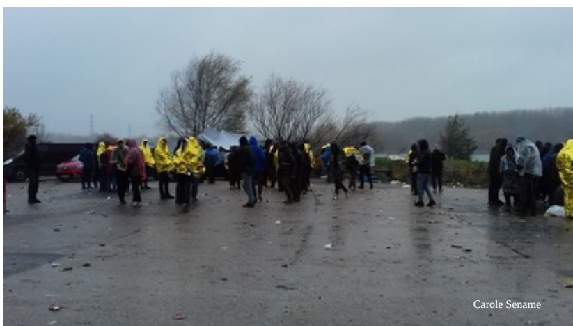
Grande-Synthe, le Puythouck

Nos amis font du feu. Dès qu'on pose une cigarette ou un carton, il est brûlé aussitôt pour procurer un peu de chaleur. A Calais, régulièrement la police emporte le bois, une petite fille est un jour tombée dans le feu et s'est sévèrement brûlé le bras et la main.