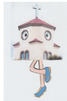
Les chaussures de la Petite Chapelle