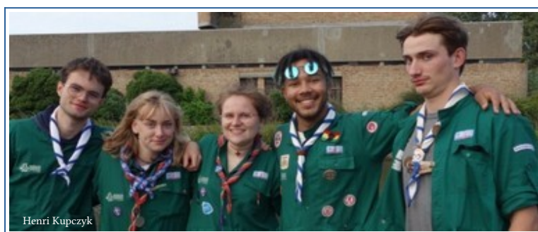
Les Comp'Accueillants, d'Alsace, à Grande-Synthe, du 09 au 22 août.