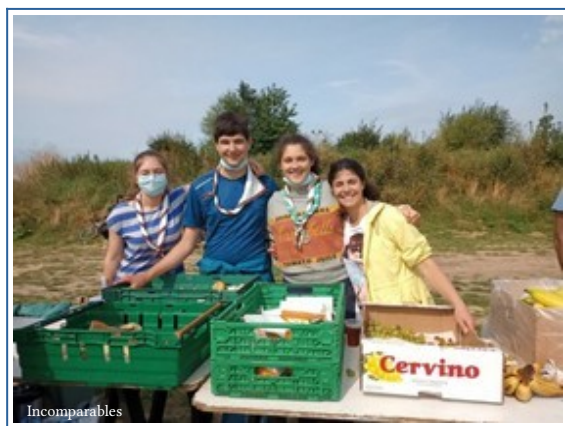
les Incomparables, de Marly le Roi, à Calais du 12 au 22 août.