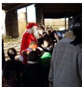
prises dans un hangar de la Linière