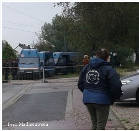
Marck, 28 septembre 2020.

Le 24 septembre, quatre fourgons de gendarmerie et deux de police s'étaient déplacés à Marck pour faire partir une dizaine de gamins mineurs.