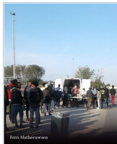
Distribution au BMX fin septembre

« On constate votre présence depuis plusieurs semaines sur ce site - propriété de l'agglomération de Calais – ce qui ne va pas sans créer de difficultés, allant jusqu'à occuper les mêmes plages horaires d'intervention de nos opérateurs (je vous en rappelle les horaires : tous les jours de 9H30 à 11H00 le matin et de 14H30 à 16H15 l'après-midi) (...) Je vous demande donc de ne plus intervenir sur cet espace public aux mêmes lieux et horaires de travail que ceux de nos opérateurs. »