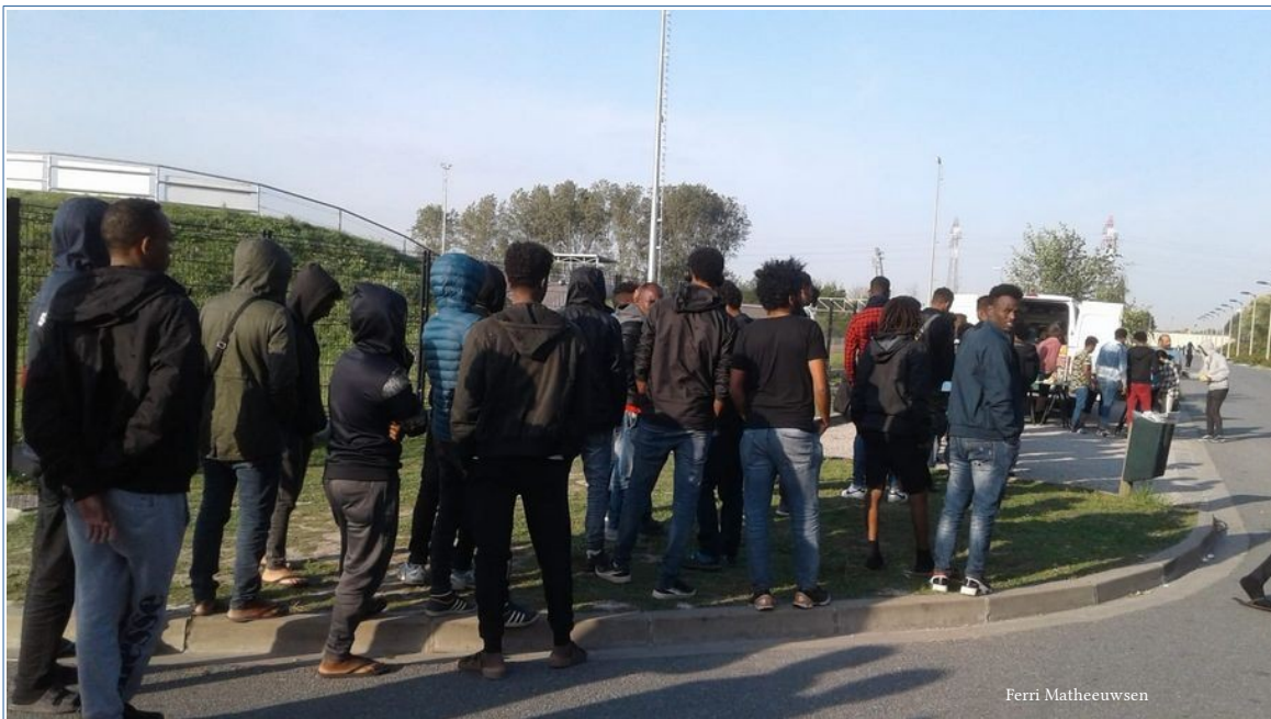
BMX fin septembre

DE NOUVELLES PERSONNES ARRIVENT DE JOUR EN JOUR, hommes seuls et familles.