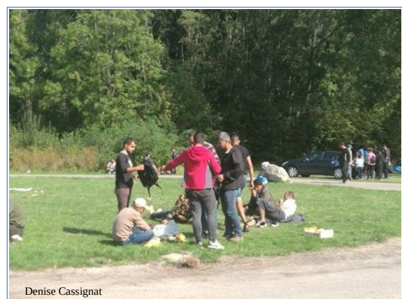
Distribution du 10 septembre sous le soleil