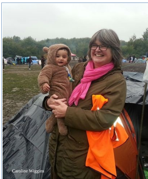
camp du Basroch, en novembre 2015.