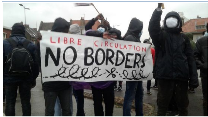
Texte et photos Ferri Matheeuwsen (26 septembre 2020)

Ferri est une bénévole qui vient de Hollande.