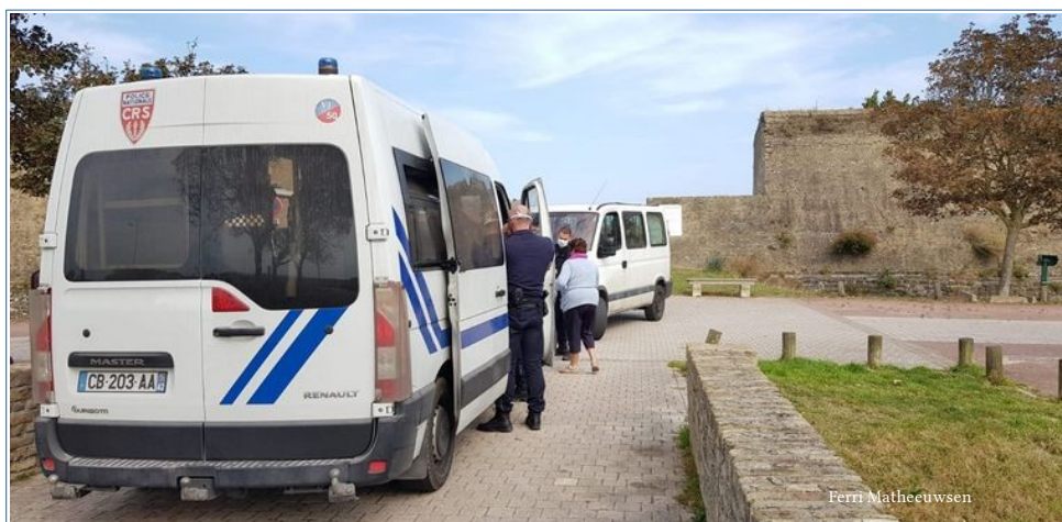
20 septembre Fort Nieulay

Un mot du président : communiqué de presse du 12 septembre :