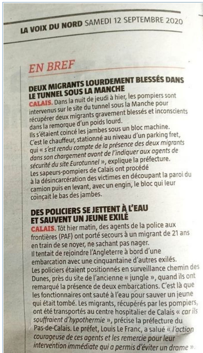
Voix du Nord du 12 septembre 2020, photo Claire Millot.