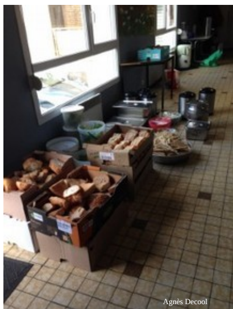
Après le travail