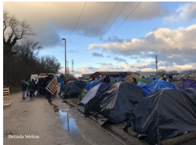
L'équipe Salam livre du bois.