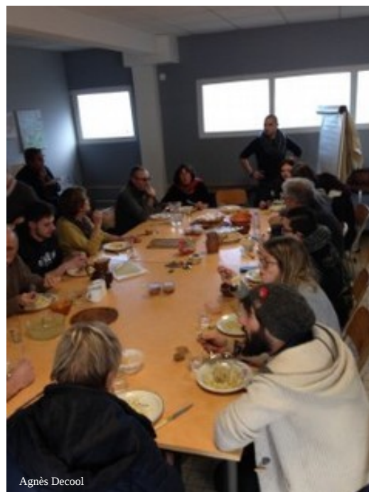
Salle Guérin, un moment de paix...