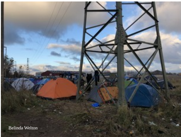
Le camp des Iraniens