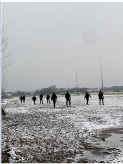
Même dans la neige...