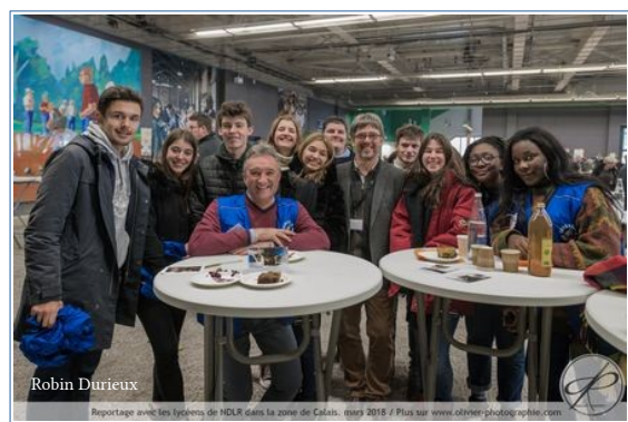
Archives : mars 2018