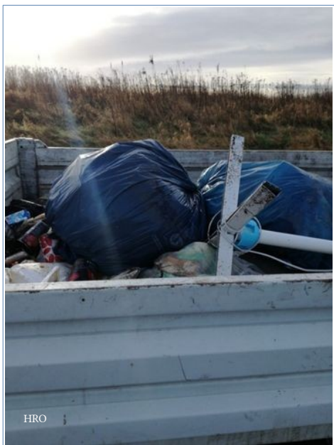
Calais, 4 février

Au cours des opérations de police, le matériel continue à être enlevé :