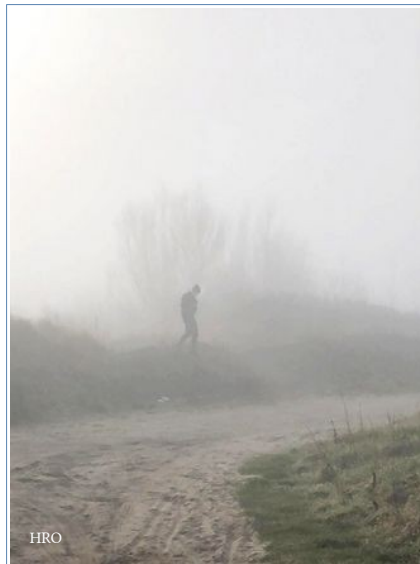
... et dans le brouillard : on voit la police emporter une bâche