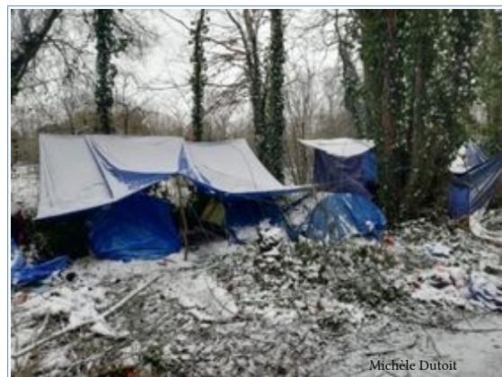
Grande-Synthe, 9 février