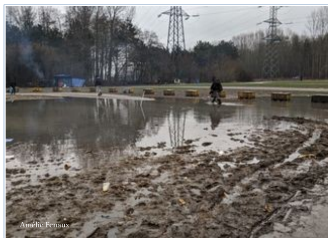
Grande-Synthe, 1 er février