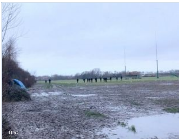
Calais , 2 février