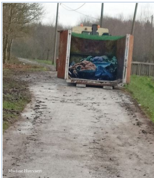
Grande-Synthe, 5 février

A Grande-Synthe : le 3 février, 48 tentes et 29 bâches sont enlevées, le 5 février 25 tentes et 40 bâches, le 23 février 106 tentes et 121 bâches !!!