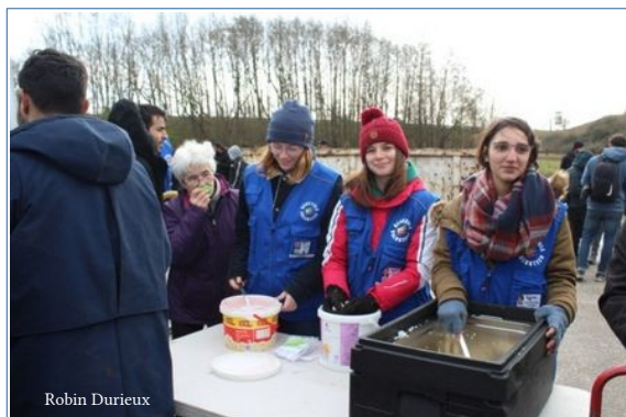
Archives : février 2020