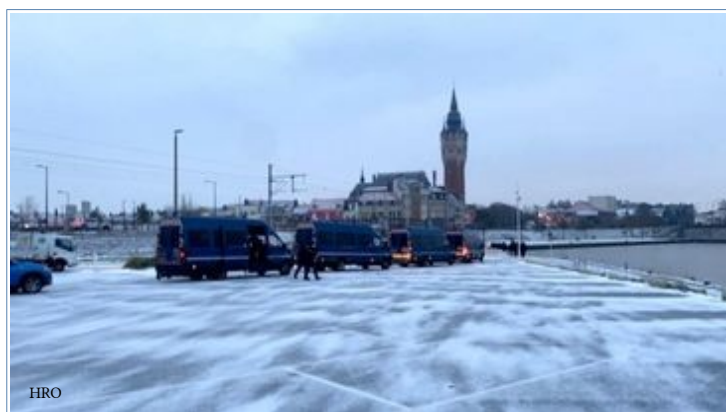
Calais, 8 février

Puis la neige est arrivée, et après elle un froid mordant.