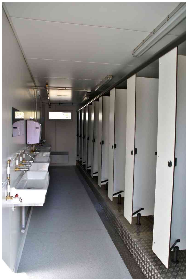
Les douches et les lavabos