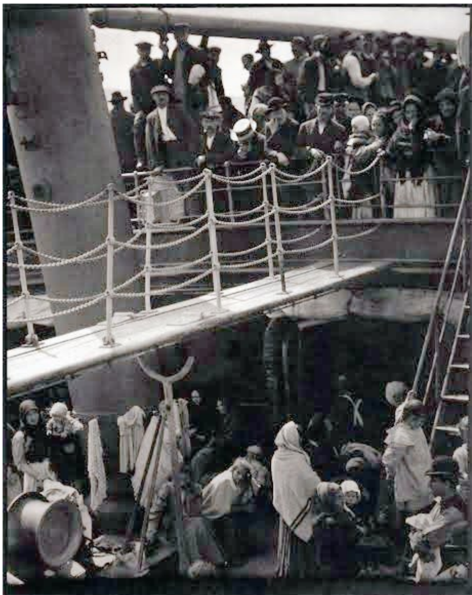
Illustration : « L'Entrepont (The steerage) » par Alfred Stieglitz.

Cette photo a été prise en 1907. La version que nous en donnons a été publiée dans la « Revue 291 » en 1915.