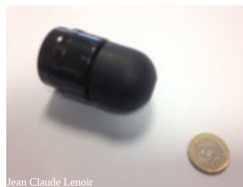
Jean Claude Lenoir

Les conditions sont depuis le 9 juillet partout de plus en plus dures : Dans la semaine du 8 au 13 juillet un gars est jeté par terre par un tir de flash ball dans le dos. Nous avons ramassé le projectile :