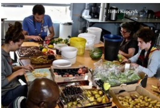
La préparation des repas, avec nous

qui ont passé avec nous la période du 12 au 24 juillet, toujours disponibles, efficaces et de bonne humeur. Ils ont tout fait :