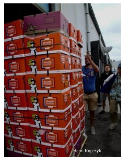
La collecte des bananes à Loon Plage.