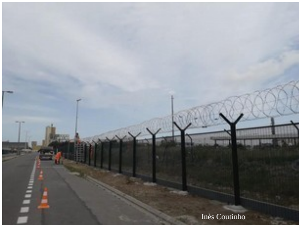
3 juin, rue des Mouettes

Les grillages se multiplient, qui limitent de plus en plus l'espace où des tentes peuvent être installées et où les associations peuvent faire des distributions sereines.