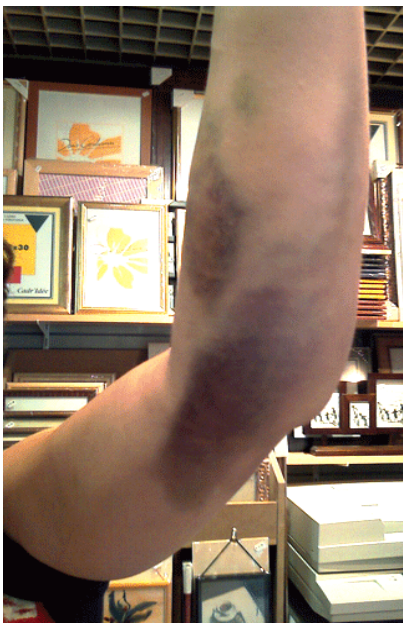
Blessures subies par Évelyne.

Évelyne dit s'être mise à pleurer et avoir demandé au policier pourquoi il se conduisait d'une manière aussi