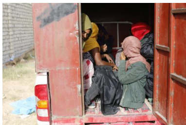
Des migrants subsahariens transférés dans un centre de détention en Libye, le 17 juin 2014.

D'après leur récit, ils ont déboursé 950 dinars, soit près de 650 euros (en cash ou via des transferts d'argent). La plupart vivaient en Libye depuis des mois, voire des années. Beaucoup auraient souhaité s'y installer si les conditions de vie ne s'étaient pas détériorées. Le racisme latent s'est transformé en chasse aux Noirs. «L'un d'entre eux m'a dit que son patron lui a conseillé d'aller en Europe. C'est lui qui l'a mis en contact avec les passeurs», indique Matteo de Bellis. «Un autre m'a dit avoir été détenu pendant plusieurs mois dans un centre de détention pour migrants illégaux», ajoute-t-il. Ces lieux sont connus pour être de véritables enfers, gardés par des hommes en armes.