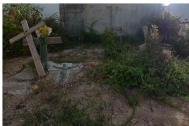
Des tombes anonymes de migrants à Lampedusa en juillet 2012 (CF).

vitalité des gangs est proportionnelle à la fermeture des frontières, toute barrière produisant automatiquement les possibilités de son contournement.