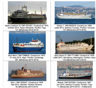
L&#039;association Robin des Bois a recensé des cargos susceptibles de connaître le même sort que l&#039;Ezadeen et le Blue Sky M.

s'en débarrasser en les revendant à des trafiquants intéressés par un navire bon marché et destiné à un unique voyage.»